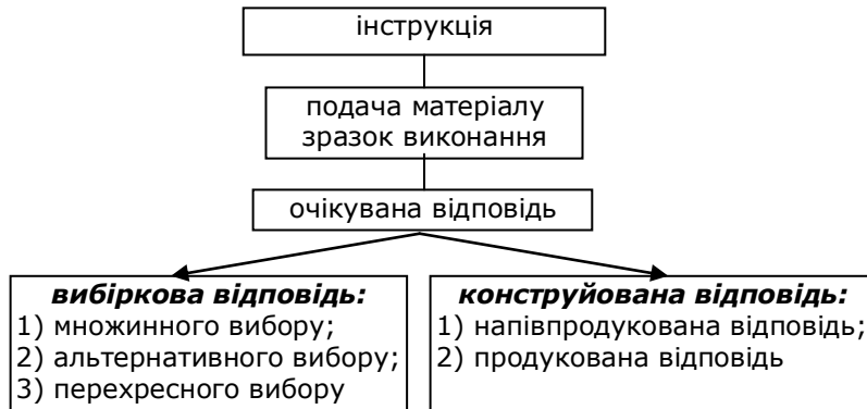
Рис.1 Структура тестового завдання

Кожне тестове завдання складається з інструкції, зразка виконання (іноді може бути відсутнім), матеріалу, що подається тестованому та очікуваної відповіді, яка планується розробником тесту як еталон/ключ (рис.1) [1].