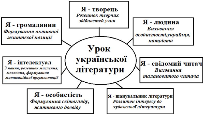
Рис.2 Напрями діяльності на уроках української літератури

Великі можливості у вирішенні проблеми соціалізації дає реалізація соціокультурної лінії на уроках української мови. Так, при вивченні у 8 класі теми «Розділові знаки при вставних словах» на етапі актуалізації вивченого учнями ставиться лінгвістичне завдання: прослухати поетичні рядки, визначити звертання та вставні слова, охарактеризувати їх.