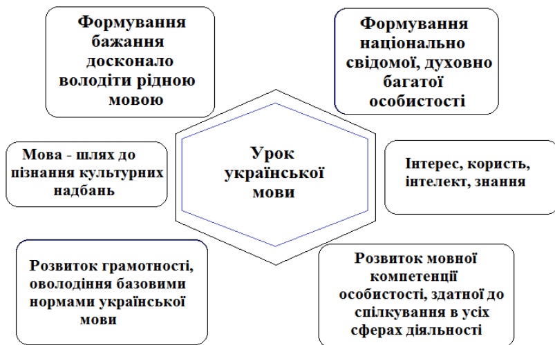
Рис.1 Напрями діяльності на уроках української мови

Залучаючи учнів до самореалізації, соціального та духовного саморозвитку, учитель веде їх до кінцевої мети – формування індивідуальності учнів, сприйняття кожного як вищої соціальної цінності. Цей процес багатоаспектний і здійснюється за багатьма напрямками (рис.1, 2).