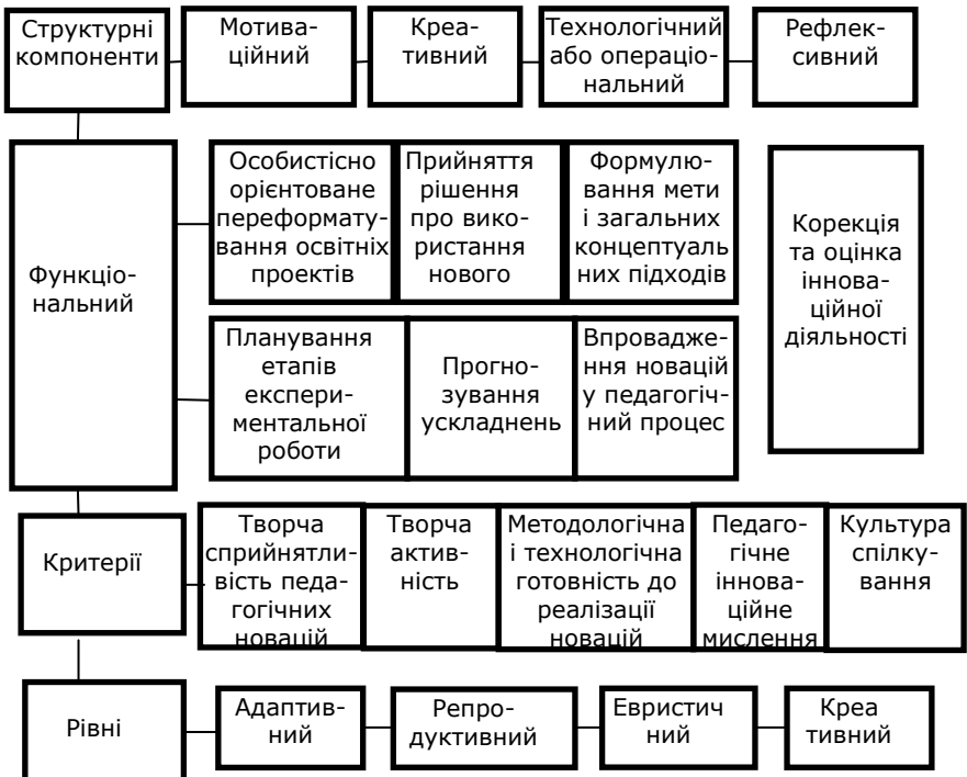
Рис. 1. Структура інноваційної діяльності

Процес інноваційних змін, як правило, здійснюється через професійну діяльність педагога шляхом упровадження результатів психолого-педагогічних досліджень. Структура інноваційної діяльності складається з наступних компонентів (рис. 1) [4]: