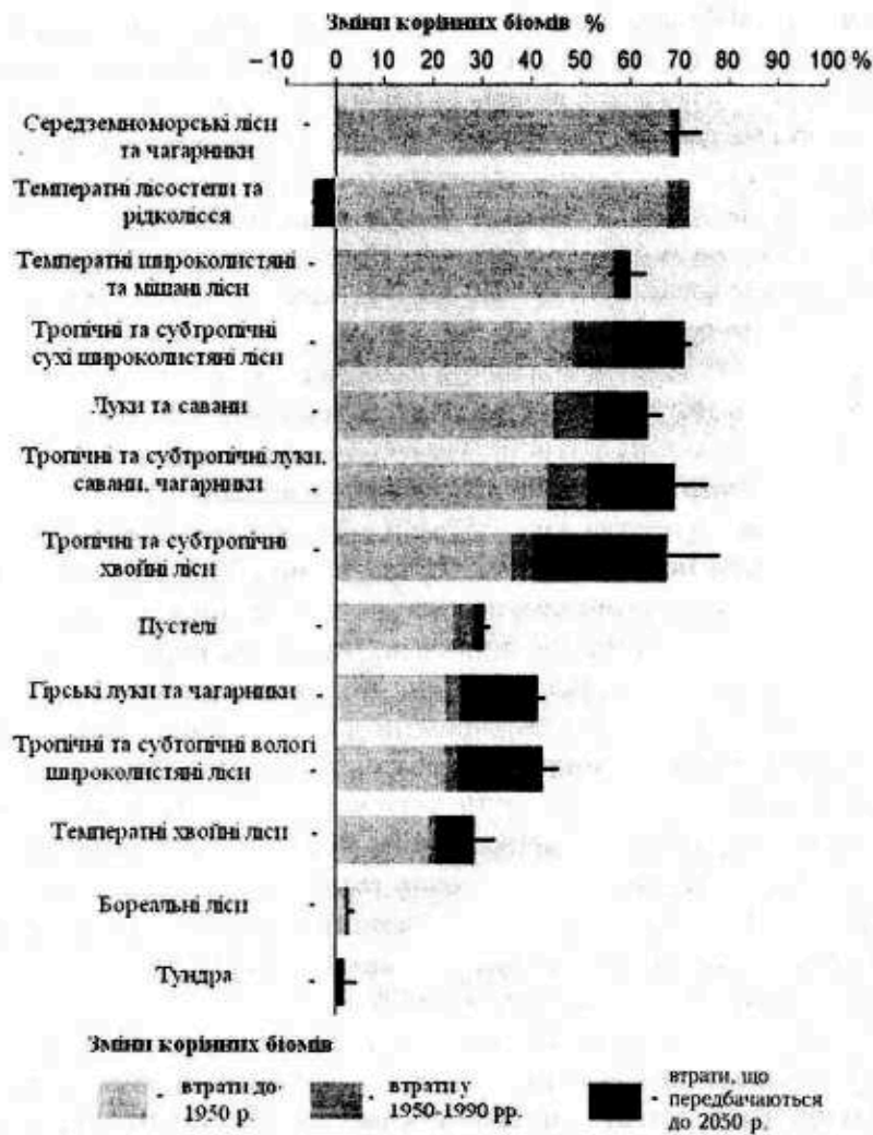
Рис. 2. Зміни біомів під антропогенним впливом (за [6])