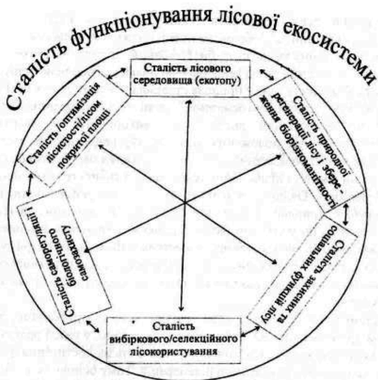
Рис. 2. Модель екологічних засад сталості наближеного до природного лісівництва (стрілками показані функціональні взаємозв'язки між елементами сталості в екосистемі)