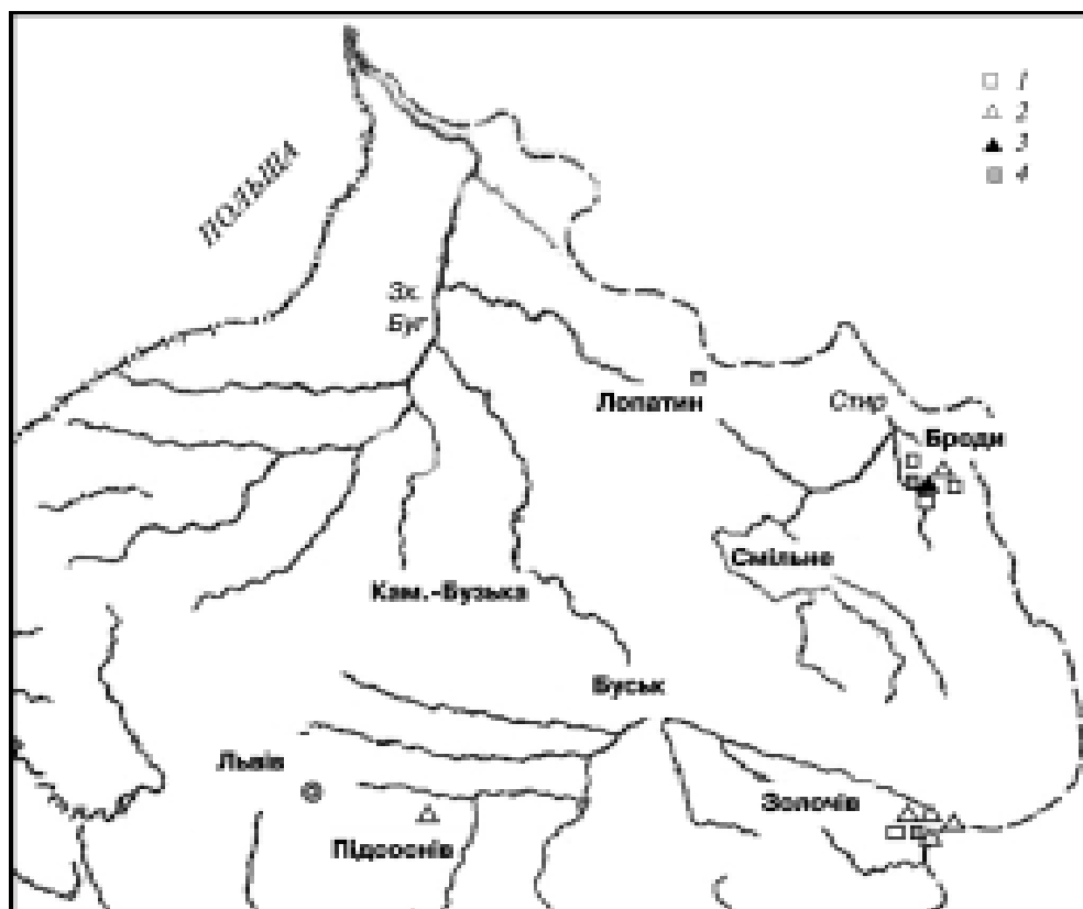
Рис. 1. Карта поширення Cladium mariscus у Львівській обл.: 1 — за гербарними зразками, зібраними до 1960 р.; 2 — за гербарними зразками, зібраними після 1985 р.; 3 — місцезростання, виявлене нами; 4 — місцезростання не підтверджені протягом останніх років Fig. 1. The map of spreading Cladium mariscus in Lviv region: 1 — according to herbarium dates (collected before 1960); 2 — according to herbarium dates (collected after 1985); 3 — habitat, exposed by us; 4 — habitats are not confirmed during last years

Першим поширення Cladium mariscus в Україні проаналізував А.І. Барбарич. Для рівнинної частини України, зокрема західних регіонів, автор навів дев'ять його місцезростань, для Львівської обл. — чотири (на півд.-зх. від Лопатина, на р. Острівці; в окол. с. Смільне Бродівського р-ну, в заплаві р. Бандурки; в околицях м. Броди; в окол. м. Кам'янка-Бузька) [3]. Більшість з них протягом останніх десятиліть не підтверджена, тому донедавна на