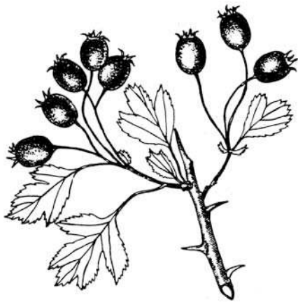
Рис. 1. Crataegus × dunensis Cin. — загальний вигляд плодоносного пагона (за Циновскисом [4])