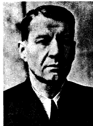
О.В. Топачевський у роки керівництва лабораторією альгології (1939—1953 рр.)