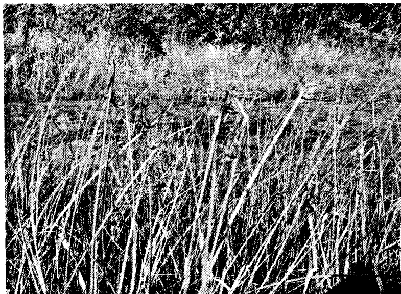
Рис. 2. Домінування Schoenoplectus pungens (Vahl) Palla в угрупованні

Появу S. pungens у виявленому місцезнаходженні ми розглядаємо з різних позицій. Перш за все, згідно з його поширенням на території Європи, в Україні знаходиться його крайня диз'юнкція на північно-східній межі ареалу. Враховуючи результати аналізу його розповсюдження в Польщі [6, с. 503; 11], де були зафіксовані найближчі до нашого місцезнаходження локалітети, можна припустити, що виявлене нами оселище знаходиться в рефугіумі як залишок міграцій атлантичних видів на південний схід Європи. Це підтверджують численні знахідки в Західному Поліссі таких видів, як Hydrocotyle vulgaris L., Carex colchica J. Gay subsp. ligerica J. Gay, Rubus orthostachys G. Braun тощо.