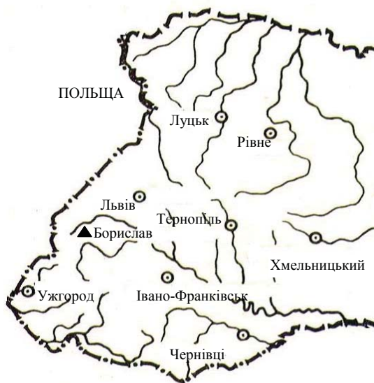
Рис 3. Нове місцезнаходження Groenlandia densa (L.) Fourr. на території України Fig. 3. New location of Groenlandia densa (L.) Fourr. in Ukraine

Попри значний ареал, на всій території поширення від поступово вимирає. Занесений до Червоних книг більшості європейських країн (Німеччини, Австрії, Польщі, Угорщини, Румунії, Болгарії, Чехії, Словаччини) [9]. Подібна ситуація склалася і в країнах Балтійського регіону. Так, у Литві та Швеції вид вважається зниклим, у Данії — рідкісним [3, 12].