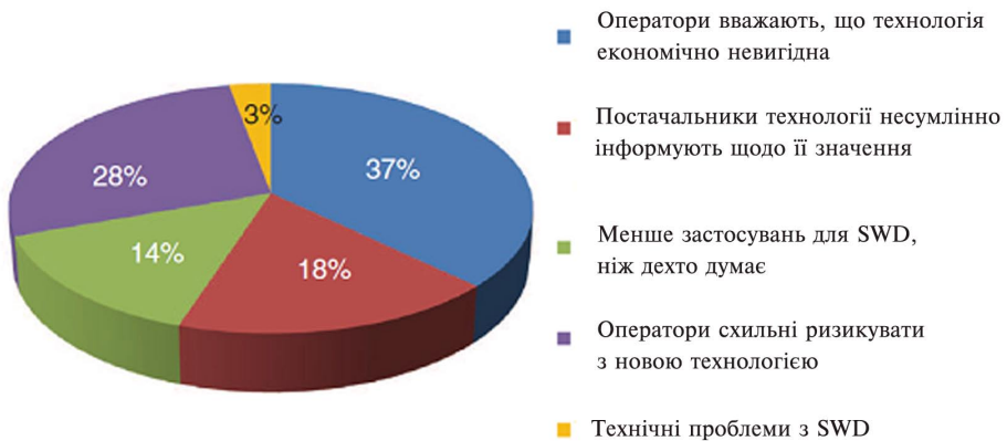
Рис. 4. Діаграма розподілу чинників, що перешкоджають запровадженню технології у виробництво

Коли справа доходить до геонавігації в цілому й процесу “бачити попереду” розміщення свердловин, порового тиску й передбачення стабільності стовбуру, потрібно поліпшити експлуатаційні характеристики свердловини. Поєднання поліпшених показників телеметрії, надійності свердловинних сейсмічних датчиків і, безумовно, ефективності обробки, моделювання й можливості інтеграції – це ключові елементи, на які спиратиметься розвиток технології СПБ. СПБ спільно з досягненнями в звичайній телеметрії й появою провідникових бурильних труб може відкрити великі можливості для свердловинних вимірювань, щоб інтерпретувати