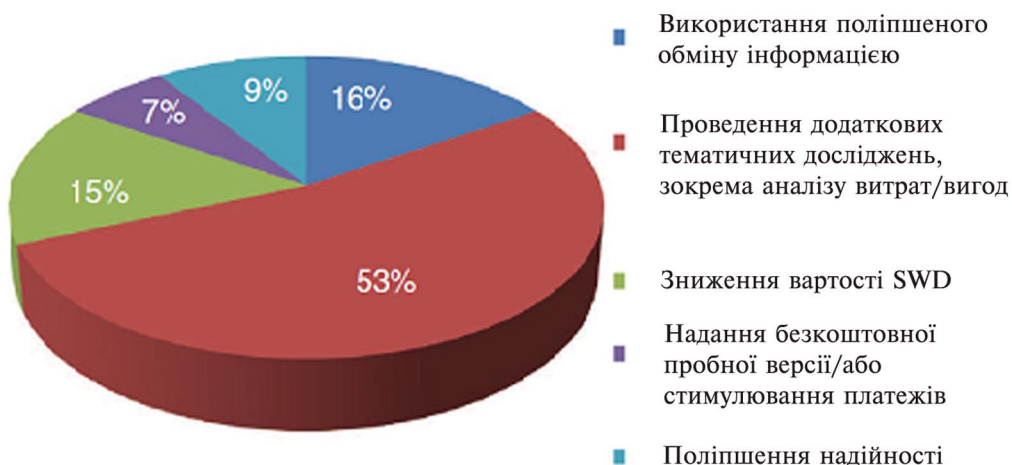
Рис. 5. Діаграма розподілу заходів, що прискорюватимуть упровадження технології СПБ у виробництво

Другий вид систем і методів СПБ ґрунтовано на використанні прямого вертикального сейсмічного профілювання в процесі буріння свердловин із застосуванням керованих наземних джерел сейсмічних коливань, що дозволяє йому забезпечити велику глибинність сейсмічних досліджень. Тому така технологія має найбільшу перспективу застосування в Україні, особливо в умовах ДДЗ. Нині для більшого поширення цієї технології потрібно забезпечити вищу завадозахищеність сейсмічних досліджень, що дасть змогу отримувати інформацію не тільки в паузах під час буріння, а також безпосередньо в процесі буріння свердловин, тобто одержувати безперервні сейсмічні