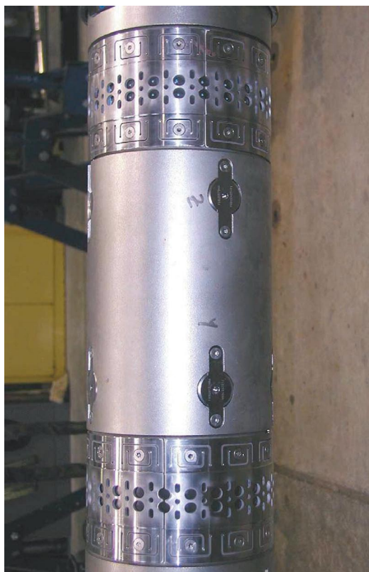
Рис. 1. Сенсорна секція інструмента, яку складено з 3-х ортогональних геофонів (середня секція) і двох гідрофонів, які розміщено над і під ними

Геофони, розміщені в зовнішньому кожусі інструмента, спеціально розроблено та встановлено так, щоб можна було впоратися з великими перевантаженнями, яких вони зазнають у процесі буріння, їх добре захищено від абразиву буріння, зносу, інтенсивної швидкості потоку й тиску. Зв'язку геофонного пакета з формацією