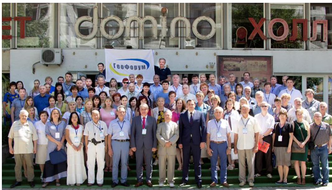
1. Геофорум-2018. “Місце зустрічі змінити не можна” – Одеса, “Мирний” курорт