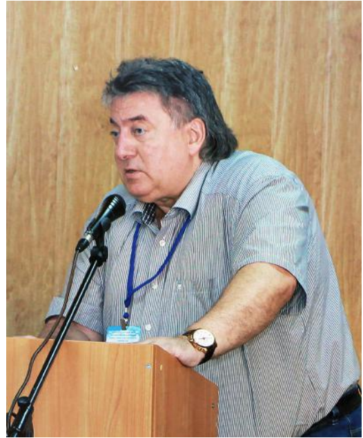
5. Г. І. Рудько, голова ДКЗ України, з програмною доповіддю