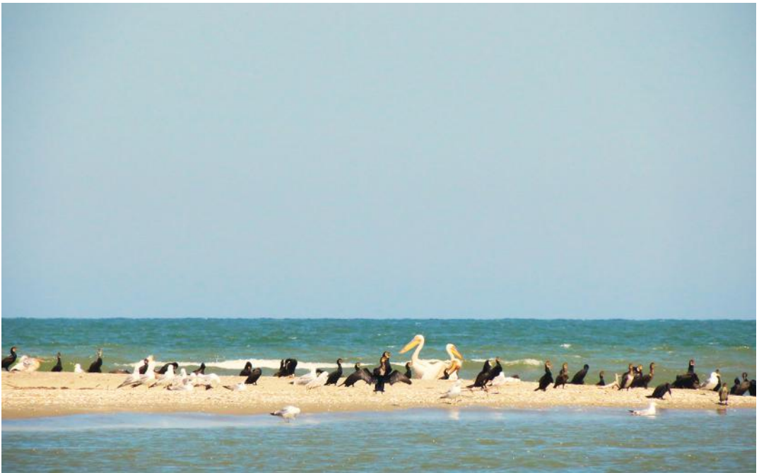
12. “Пташиний базар” у місці, де зустрічаються чорноморські та дунайські хвилі