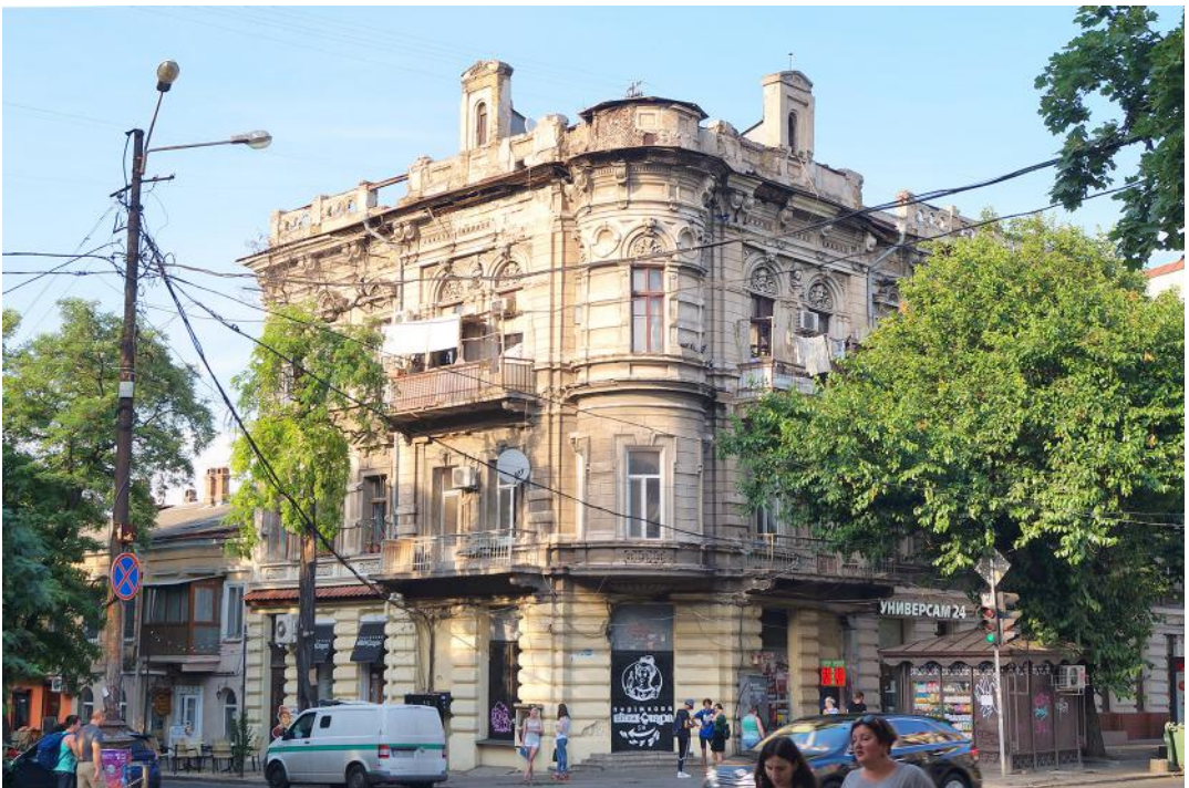
14. Типова архітектура центру Одеси