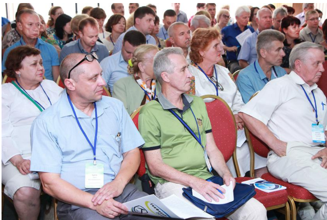
3. Під час пленарного засідання

Робота геологічного форуму в подальшому проходила в наукових секціях за напрямами з досліджень та оцінки певних територій на конкретні види корисних копалин, проблем прогнозування, пошуків і розвідки родовищ, геолого-економічної оцінки корисних копалин, вивчення нетрадиційних джерел енергетичної сировини, стратиграфічних, гідрогеологічних та екологічних досліджень, упровадження інновацій у геології і гірничодобувній галузі.