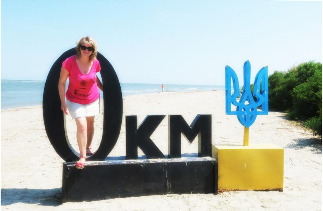
11. Місце впадання Дунаю в Чорне море. До його витoku в горах Шварцвальд (Німеччина) – 2860 км