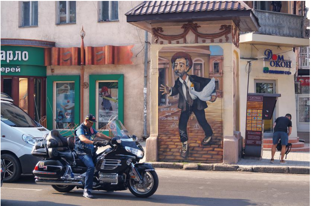
13. Одеса. На Малій Арнаутській вулиці