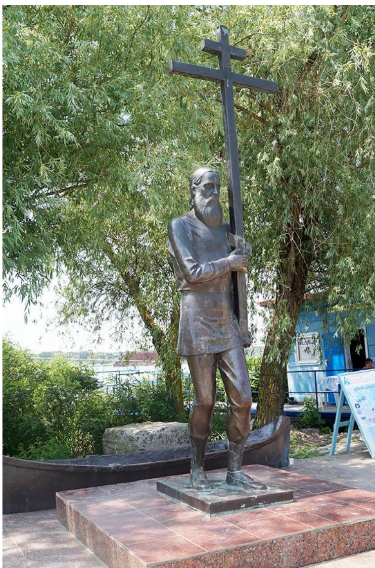
9. Пам'ятник старообрядцям – засновникам міста Вилкове

Незабутніми є враження від подорожі протоками Дунаю та охоронною зоною Дунайського біосферного заповідника до “нульового кілометра”, де зливаються