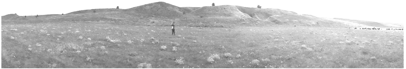
Рисунок 1. Фрагменти валів Західного укріплення Більського городища збудованих скіфами близько 2,7-2,3 тис. р. т.