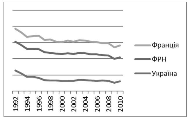
Рисунок 1б. Динаміка викидів CO 2 , окремі країни, 1992-2010 рр.