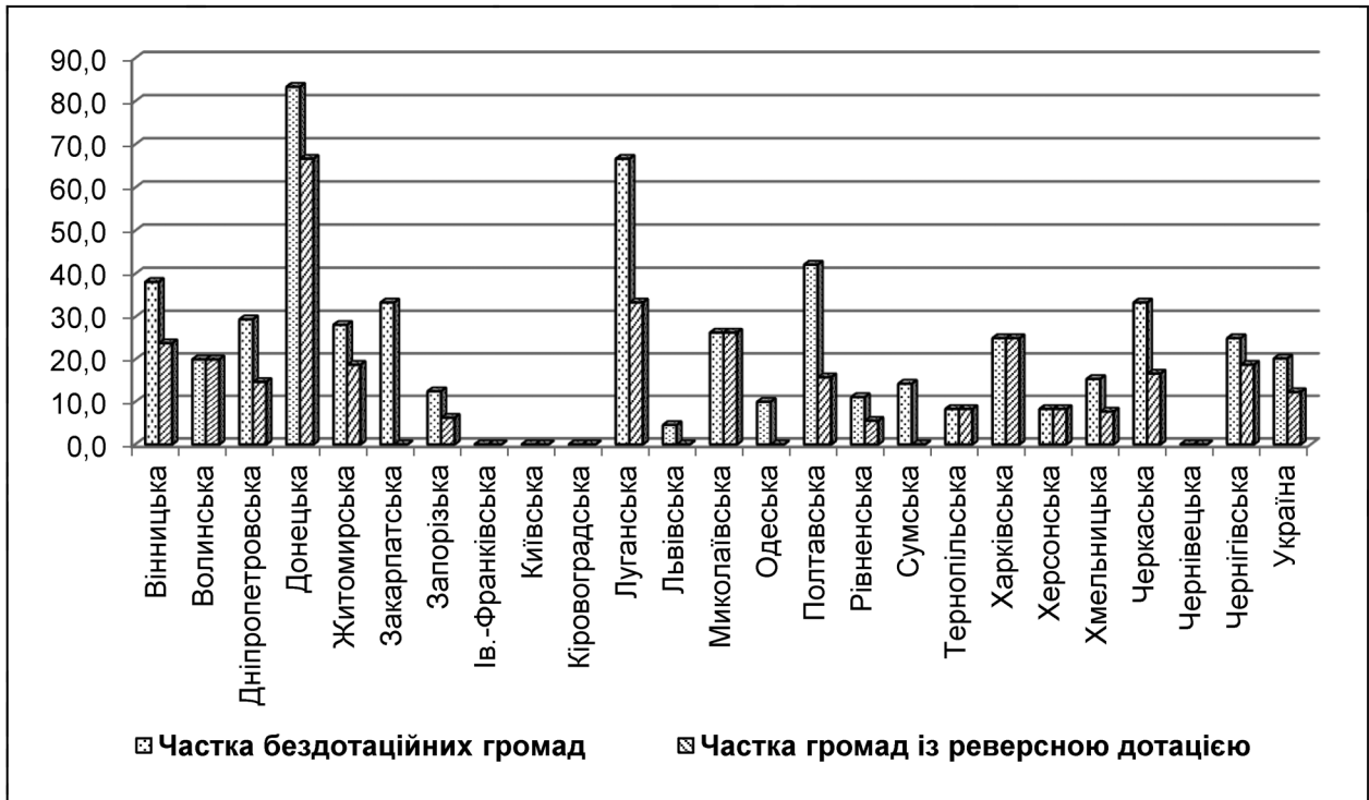
Рис. 3. Частка бездотаційних громад та громад із реверсною дотацією у розрізі регіонів України, % (перша половина 2017 р.)

громад зумовлює пошук причин такої ситуації. Чи залежить, наприклад, рівень дотаційності громад від їхніх розмірів та кількості населення, від загальноекономічних характеристик регіонів, рівня оплати праці тощо.