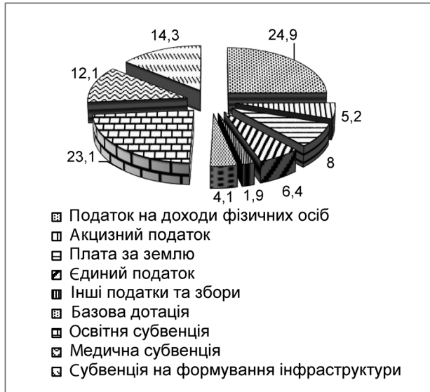
Рис. 1. Структура доходів загального фонду територіальних громад, % (2016 р.)