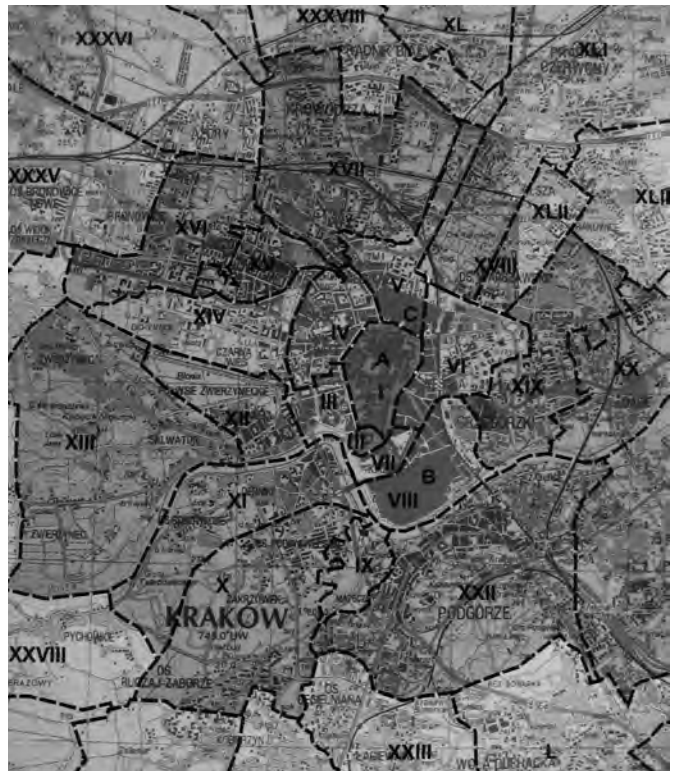
Ілюстр.3 Розвиток міської території Кракова у XIII–XX ст.; фрагмент карти (див.: Kraków // Atlas Historyczny Miast Polskich. – T.5: Matopolska. – Kraków, 2008)