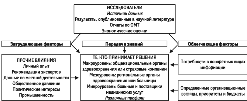
Процесс принятия решения в результате ОМТ (Velasco Garrido M. et al. (Eds), 2010, с. 163)