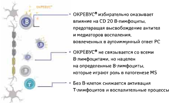
Рис. 1. Препарат ОКРЕВУС® оказывает влияние на CD20 В-клетки, которые могут играть роль в развитии РС

ствия на CD20-позитивные В-клетки (рис. 1). Эти клетки представляют специфический тип иммунных клеток, играющий ключевую роль в поражении миелиновой оболочки, выполняющей защитную и изолирующую функции, и аксонов нервных клеток, что может привести к инвалидизации пациентов. По данным доклинических исследований, препарат ОКРЕВУС® связывается с поверхностными белками CD20, экспрессируемыми на определенных В-клетках, за исключением стволовых и плазматических клеток, что позволяет сохранять важные функции иммунной системы.