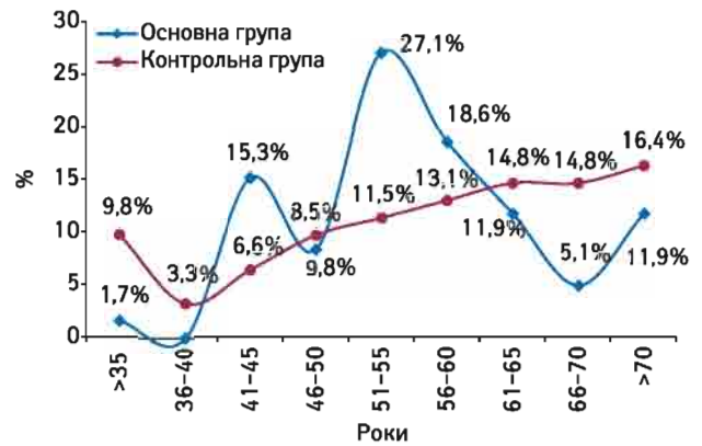
Рис. 1. Віковий розподіл пацієнок із РШМ

Зменшення радіотерапевтичного інтервалу, зумовлене підвищенням радіочутливості нормальних тканин після ХЛ, є передумовою розвитку променевих ускладнень лікування. Зважаючи на те що загоєння післяопераційного ранового дефекту є складним скоординованим процесом, представленим запаленням, пролі-