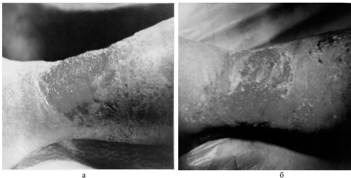
Рис. 1. Пацієнт К. Трофічна виразка гомілки:

Середній ліжко-день в основній групі склав (15,8 \pm 0,72) , а в контролі на два дні більше – (17,8 \pm 0,83) , ( p < 0,05 ), що вказує на ефективність застосування комбінованого антимікробного препарату пролонгованої дії «Гентаксан», для місцевого лікування трофічних виразок (рис. 2).