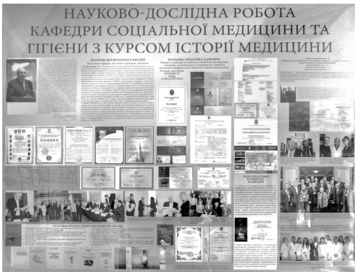
Рис. 2. Науково-дослідна робота кафедри соціальної медицини та гігієни з курсом історії медицини.

На іншому стенді висвітлено сьогоднішня кафедра та наукові досягнення її працівників (рис. 2).