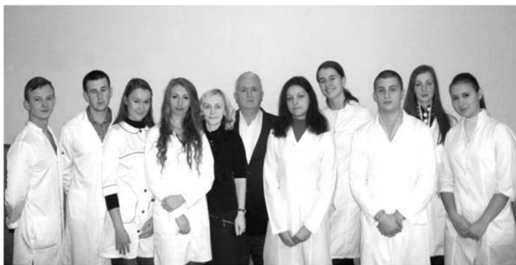
Рис. 3. Група дослідників, які працювали над збором та оформленням матеріалу.