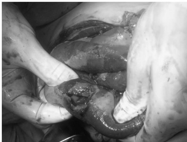
Рис. 3. Перфорація тонкої кишки при ТВ.