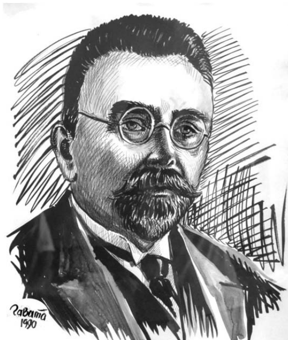
Рис. 2. Микола Дмитрович Стражеско – лікар-терапевт, один із засновників київської терапевтичної школи, у тому числі і вітчизняної кардіології, академік АН УРСР, СРСР, АМН СРСР, Герой Соціалістичної Праці.

Дав класичний опис клініки інфаркту міокарда (1910, спільно з М.Д. Стражеском).