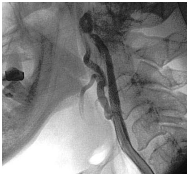
Рис. 7. Контрольна артеріографія сонних артерій (стент прохідний).

Кумулятивний аналіз позитивних результатів спостереження протягом чотирьох років засвідчив добрі та задовільні результати ендovasкулярного хірургічного лікування у 91,6% випадків.