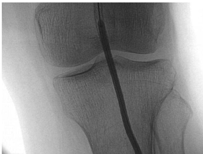
Рис. 6. Артеріограма нижньої кінцівки. Черезшкірна балонна ангіопластика при сегментарному стенозі підколінної артерії.

При виборі хірургічної тактики у пацієнтів з мультифокальним атеросклеротичним ураженням артерій нижніх кінцівок та сонних артерій слід враховувати такі критерії: