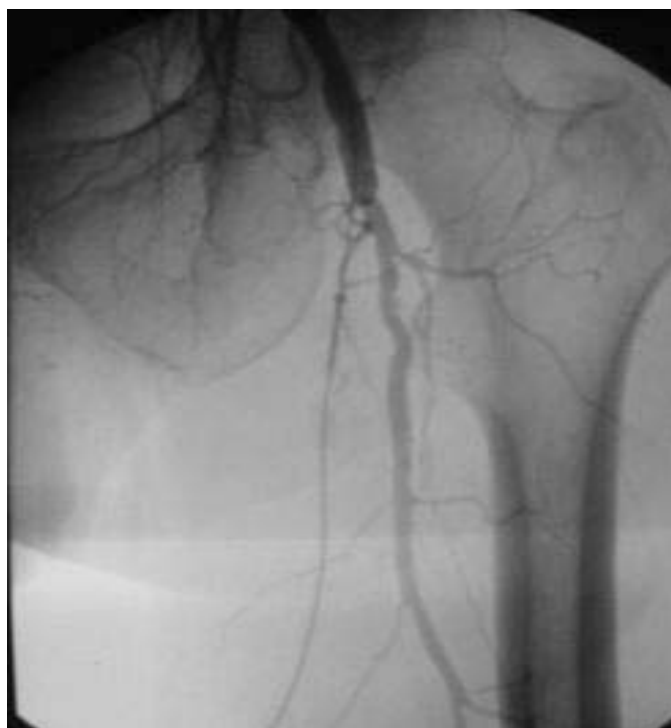
Рис. 2. Артеріограма нижньої кінцівки (поширена оклюзія стегнової артерії).