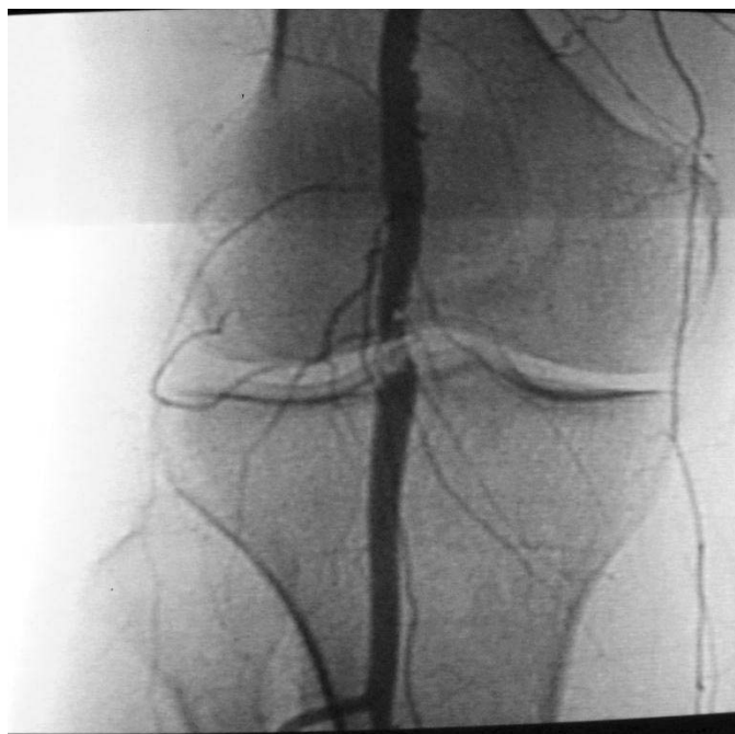
Рис. 3. Артеріограма нижньої кінцівки (локальна оклюзія підколінної артерії).

Віддалені результати ендоваскулярного лікування проаналізовано впродовж чотирьох років спостереження. Контроль здійснювався за допомогою контрастної ангіографії та ультразвукової доплерографії екстракраніальних артерій та артерій нижніх кінцівок з оцінкою зони реконструкції через 6 та 12 місяців, а потім – щорічно.