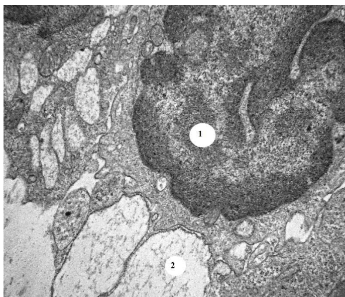
Рис. 3. Ультраструктура епітеліоцита війкового відростка очного яблука білого щура-самця через шість тижнів введення налбуфіну з наступною двотижневою відміною. 1 – ядро епітеліоцита; 2 – вакуолізація епітеліоцита. Електронна фотографія. 36. x 4000.

знаходяться на стадії розпаду, що супроводжується утворенням ниток амілоїду. Виявлено також і «світлі» епітеліоцити, що знаходяться на етапі утворення складок, характерних для контролю, проте цей процес не прямує до спеціалізації, оскільки не виявлено форм «проміжних» високодиференційованих клітин. Навпаки, такі «світлі» клітини мають гіпертрофований комплекс Гольджі, багато лізосом, аутофаголізосом, вакуолі. Система їх внутрішніх мембран розпушена. В основі війкових відростків електронна щільність епітеліоцитів незначна, спостерігається вакуолізація і розпад клітин з наступним потраплянням їх в просвіт задньої камери ока. В збережених елементах базальної мембрани виявлено лейкоцити. Спостерігаються також вогнища клітин низького ступеня диференціації. Ці клітини мають великі ядра і вузький обвід цитоплазми.