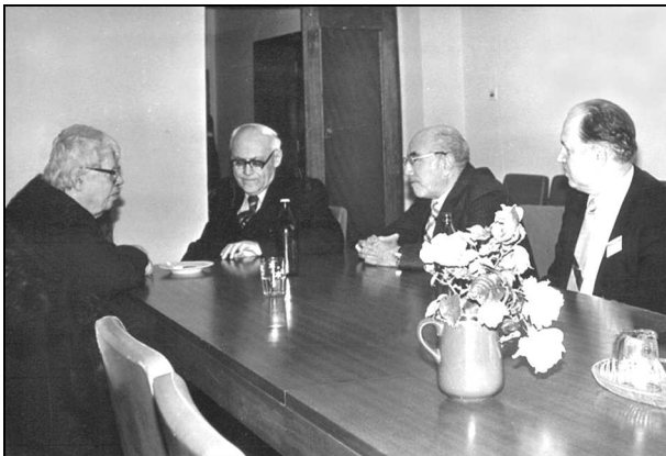
Міжнародна конференція в Інституті теоретичної фізики АН України з нелінійних явищ. Київ, 1984 р. Ліворуч : М.М. Боголюбов, О.І. Ахієзер, Я.Б. Зельдович, В.Г. Бар'яхтар