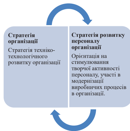
Рис. 4. Взаємозв'язок стратегії техніко-технологічного розвитку організації зі стратегією розвитку персоналу організації