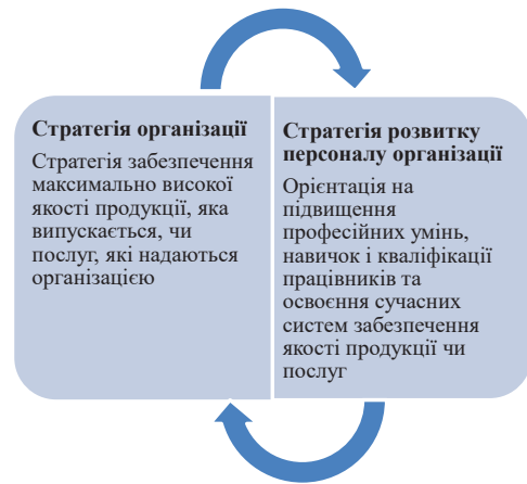
Рис. 2. Взаємозв'язок стратегії якості продукції (послуг) зі стратегією розвитку персоналу організації

2) Стратегія техніко-технологічного розвитку організації передбачає з позиції стратегії розвитку персоналу організації ініціативність, творчість та активну участь працівників у науково-дослідних роботах (рис. 4).