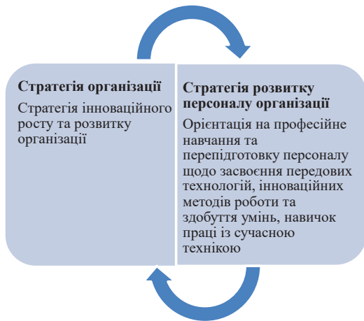
Рис. 3. Взаємозв'язок стратегії інноваційного росту та розвитку організації зі стратегією розвитку персоналу організації