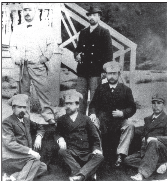
Фото. 5. Представители московской школы агентов наружного наблюдения. 1900-е годы