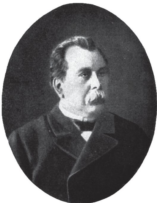
Фото. 1. Плевэ В. К. (1846–1904)