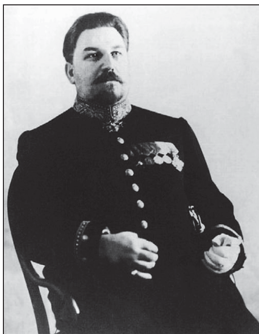
Фото. 3. Медников Е. П. (1853–1914)