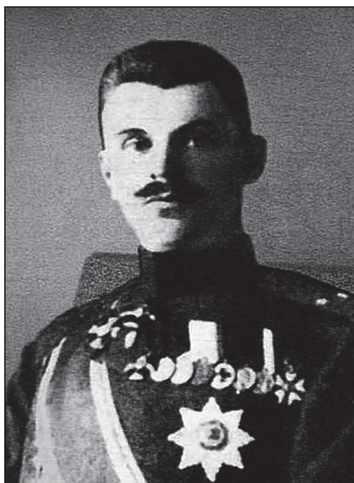
Фото. 4. Спиридович А. И. (1873–1952)