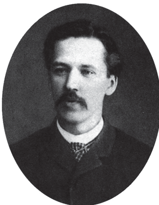
Фото. 2. Зубатов С. В. (1864–1917)