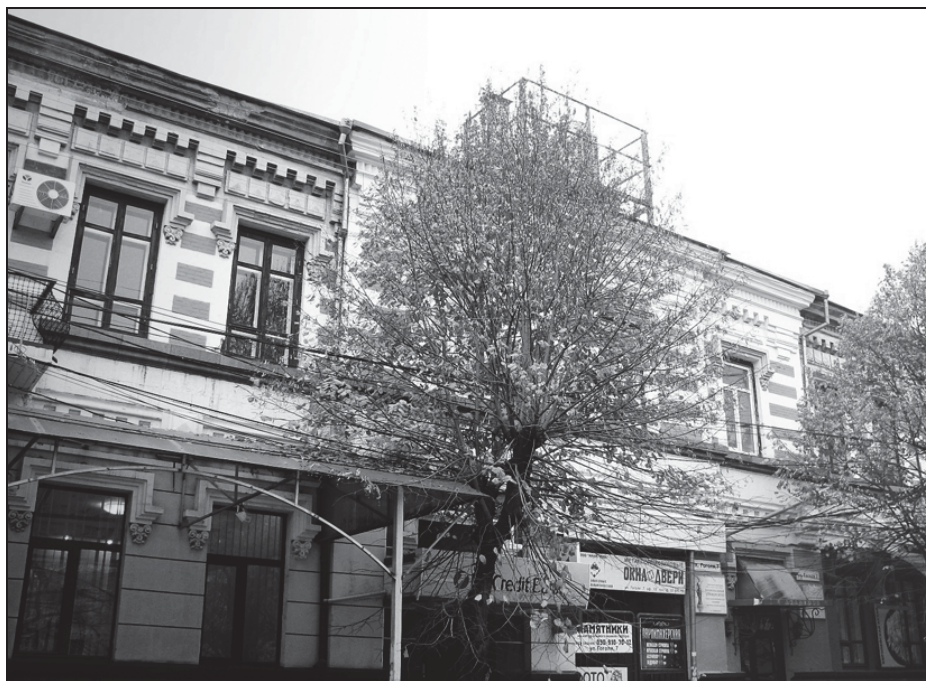
Фото. 7. Здание, где размещалась канцелярия Таврического охранного отделения. Фото 2013 года