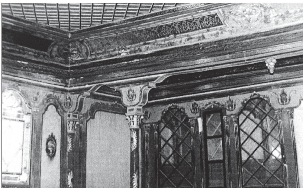
Рис. 2. Общий вид перекрытия над Золотым кабинетом