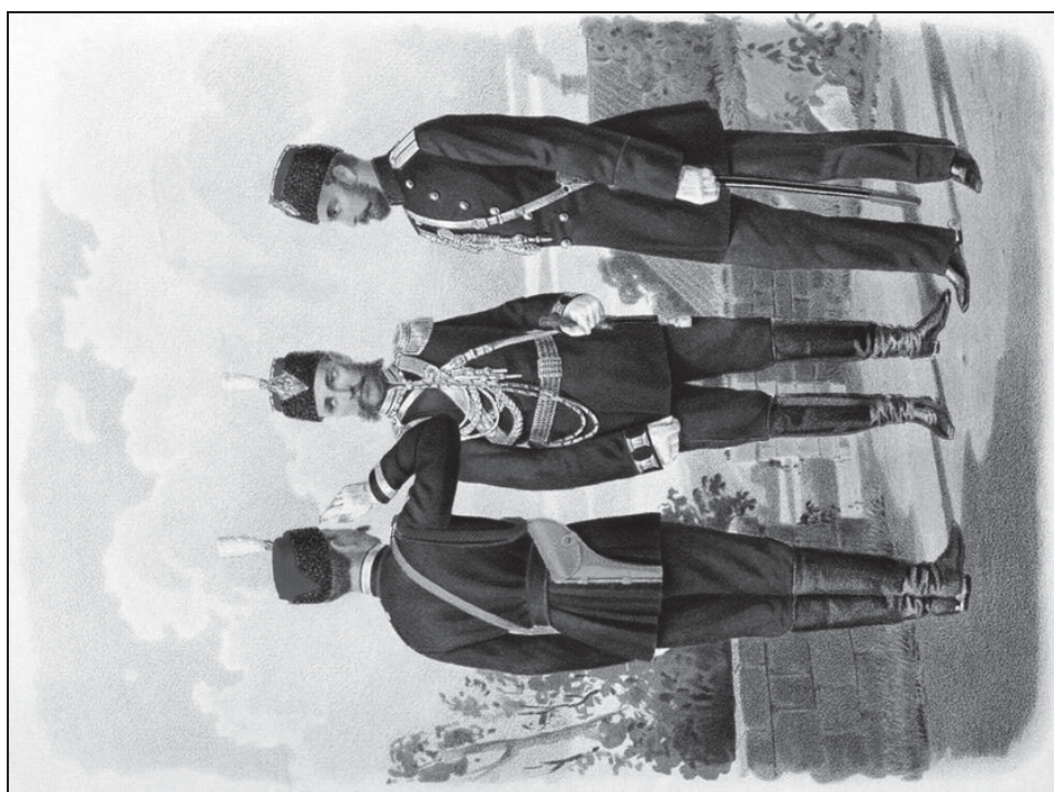
Рис. 3. Штаб-офицер, обер-офицер и унтер-офицер Отдельного корпуса жандармов (1884 г.)