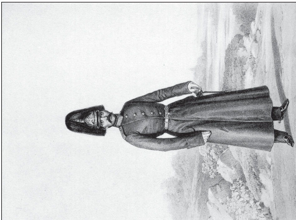
Рис. 2. Обер-офицер Корпуса жандармов (1854–1855)