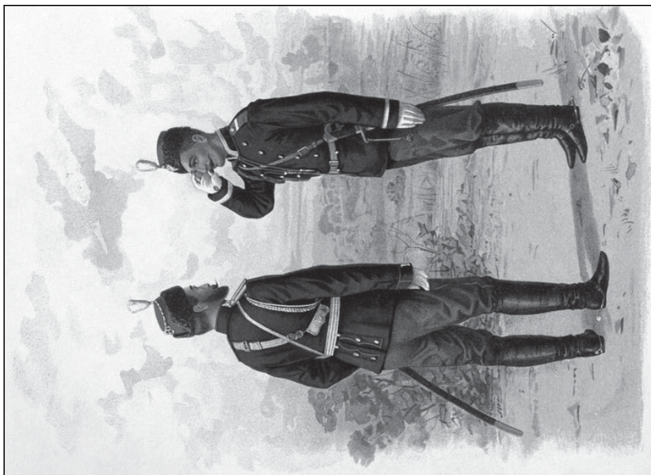
Рис. 4. Обер-офицер и вахмистр Отдельного корпуса жандармов (1897 г.)