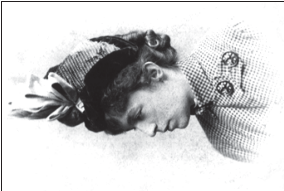
Фото 2. Е. П. Бенард, [1881]