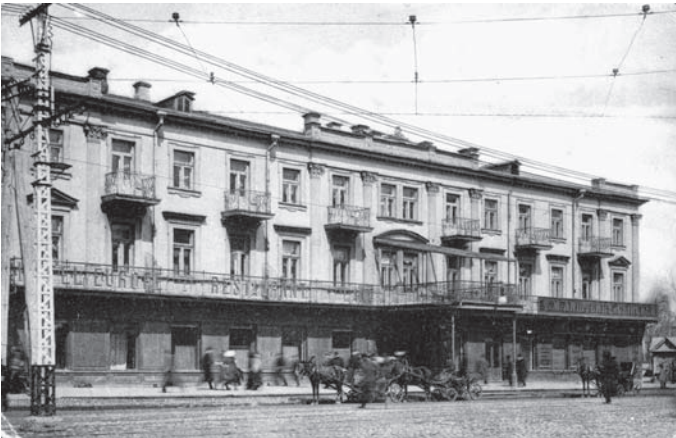
Іл. 7. Фасад готелю “Європейський” з 90-х років XIX ст. до 20-х років XX ст.