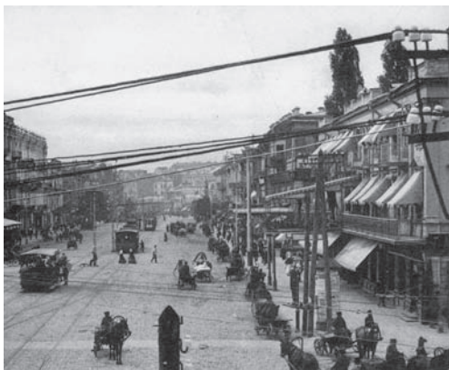
Іл. 5. Закриті маркізи на вікнах готелю

Варто зауважити, що подібна зміна зовнішнього виду виявилася також дуже вірним іміджевим вирішенням. Розташований на одній з головних площ міста, готель почав слугувати зручною глядацькою трибуною. Під час військових парадів та інших велелюдних заходів саме на балконах готелю “Європейський” збиралася вишукана публіка для пере-