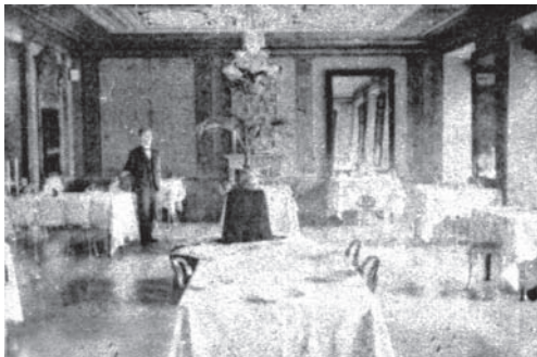
Іл. 3. Ресторанна зала

Зазвичай основні роботи з оснащення та оздоблення виконувалися один раз під час будівництва, потім, окрім побіжного ремонту, не робилося нічого.