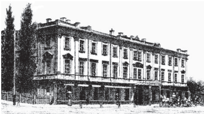
Іл. 1. Готель “Європейський”. Арх. О. Беретті. 1858

Якщо на 1824 рік у Києві офіційно було лише 2 готелі, у 1866 році — до 30, то наприкінці XIX ст. їх вже налічувалося понад 100.