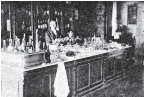
Іл. 2. Буфет готелю

На той час готель мав усю необхідну інфраструктуру: гарний ресторан, просторий хол, окремі кабінети, буфет (іл. 2), більярд, великий салон, екіпажі для їзди містом, господарське подвір'я, а також нову західноєвропейську "родзинку": "В заведеніи устроены ванне с речной водой и находятся все удобства..." [2]. Під словом "усі зручності" йшлося про окремі теплі