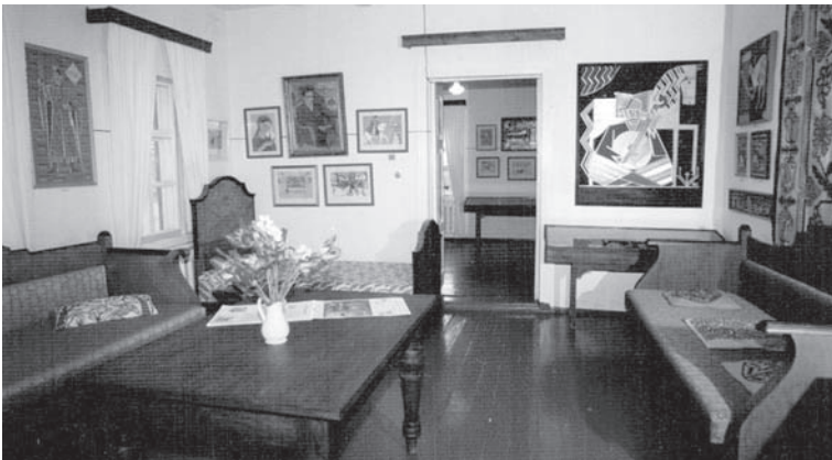
Іл. 5. Фрагмент експозиції художньо-меморіального музею "Садиба народного художника України Олександра Саєнка" з авторськими творами та диваном з колекції О. Саєнка