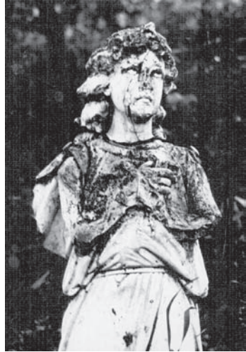
Іл. 4. Янгол з поховання біля Миколаївської церкви у м. Борзна Чернігівської області. Мармур

Як видається, побіжний огляд колекції творів образотворчого і декоративно-ужиткового мистецтва та предметів побуту Борзнянщини дає