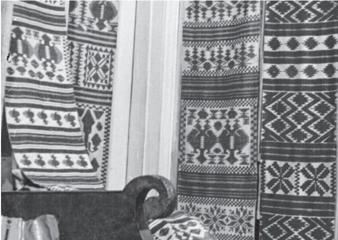
Іл. 3. Крелевецькі рушники з колекції О. Саєнка

геометричні узори: пряма, зазублена чи хвиляста смуга, гострокутна розетка, ромбовидні фігури у різноманітному трактуванні, які часто поєднані зі стилізованими мотивами плаваючих птахів, розквітлих вазонів, деревом життя з бутонами, архітектурних силуетів, символом царської влади — двоголового орла, увінчаного короною (іл. 3).