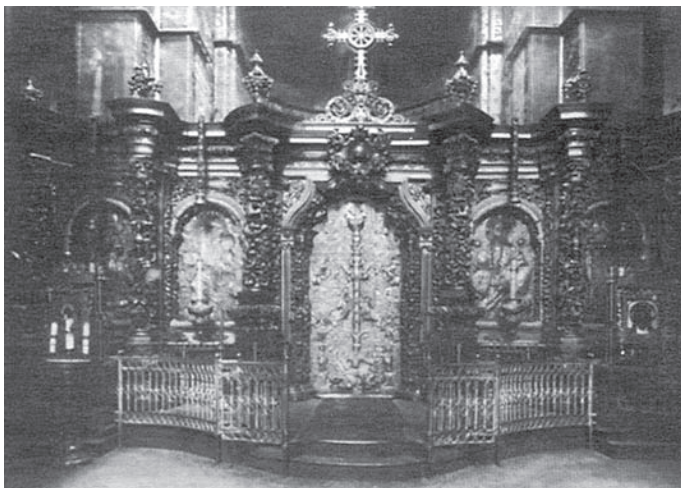
Лл. 3. “Єлизаветинський” іконостас після 1888 року.