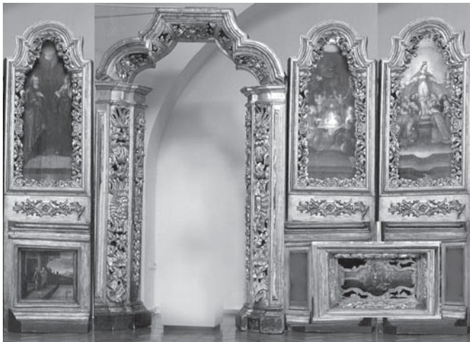
Лл. 5. Реконструкція фрагмента іконостаса діаконика — бічного вітваря Святих Іоакима і Анни.

Фрагмент іконостаса діаконика включає ікони “Різдво Богородиці”, “Собор Пресвятої Богородиці” і “Сон Іакова”, які знаходяться в головному просторі собору; ікони “Зачаття Пресвятої Богородиці”, “Авраам і Сарра” та арка бічних врат жертвника знаходяться в експозиції південної галереї другого поверху.*