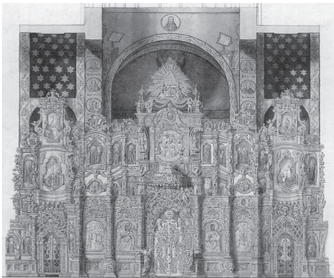
Лл. 1. “Єлизаветинський” — головний іконостас Собору Софії Київської (1731–1754). Малюнок — акварель Ф. Солнцева [10, с. 42].

“Єлизаветинський” іконостас закриває головний престол Софії — Різдва Богородиці і два бічних приділи: жертвенник і бічний вістар Іоакима і Ганни. Складається з цокольного, намісного, святкового, апостольського і пророцького рядів. Отже, якщо спиратись на свідчення П. Лебединцева про те, що в 1846 році був знятий пророцький ярус [6], то акварель можна датувати не пізніше 1846 року