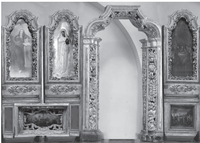
Іл. 4. Іконостас бічного вітваря Софії Київської. Реконструкція фрагмента іконостаса жертovníка.

Фрагмент іконостаса жертovníка включає ікони “Іоанн Богослов”, “Пресвята Богородиця — Сімеоново пророцтво” і “Міянний змії”, які знаходяться в головному просторі собору; ікони “Тамна вечеря”, “Зустріч Авраама з Мельхіседеком” та арка бічних врат жертovníка знаходяться в експозиції південної галереї другого поверху