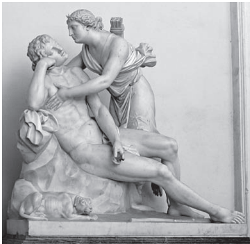
Іл. 1. П. А. Трискорні. Діана і Ендіміон. Мармур. (Підпис праворуч на підставці: P. TRISCORNI)