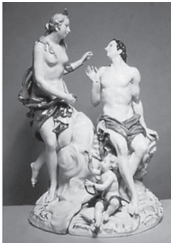
Іл. 2. Ф. Е. Мейєр. Діана і Ендіміон. Мейсенський фарфор

Етимологія слова “Артеміда” нез’ясована досі: деякі дослідники вважали, що ім’я богині в перекладі з грецької мови означає “ведмежа богиня”, інші — “володарка” або “вбивця”.