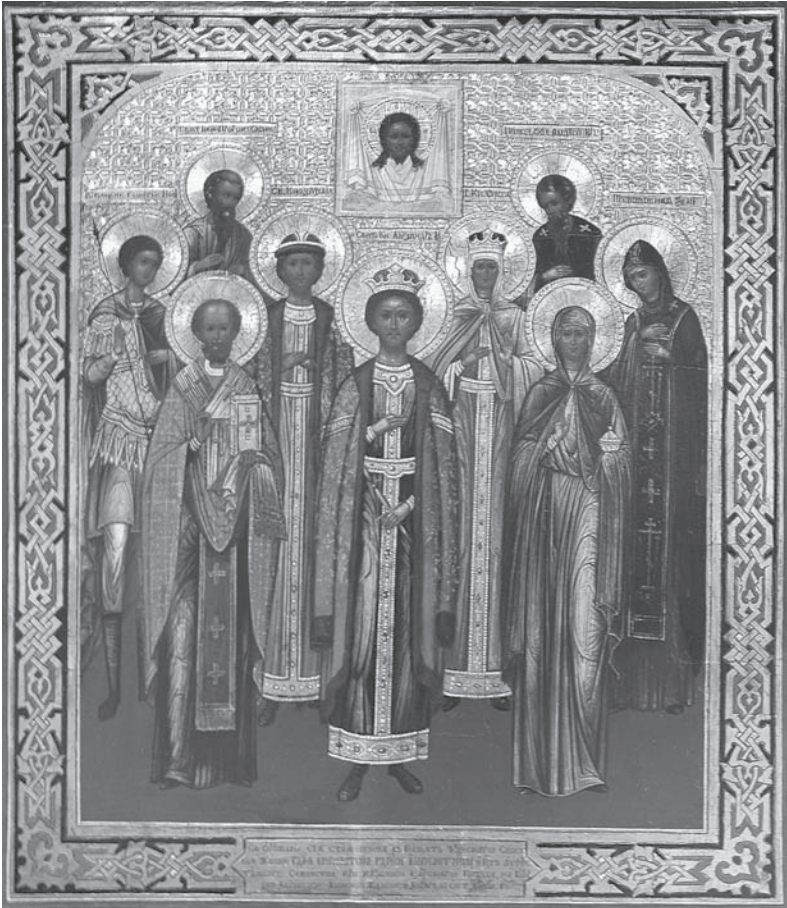
Іл. 2. Ікона “Чудо Милости Божией над Царским Семейством и Россией, 17 октября 1888 г.” (Приватна збірка)

раження святих патронів царської родини.