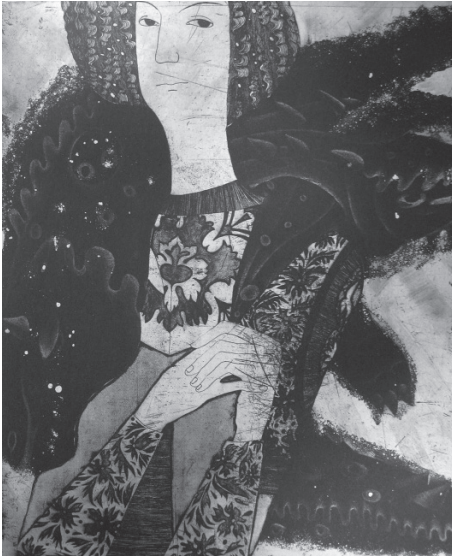
Іл. 3. О. Стратійчук. Портрет. Офорт, мецо-тинто, 58,5x50. 1990

прогресивного формалізму та концептуальне мистецтво поряд з ілюстративним чи іронічним фігуративізмом.