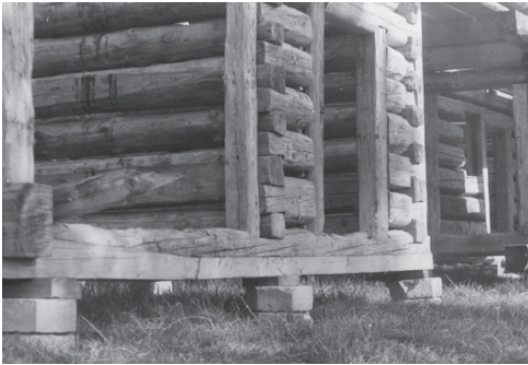
Реставрація кутового замка вінця стіни

режами) і як магніт притягують потенційних «інвесторів» для різного роду будівництва (дач, готелів, розважальних закладів, автозаправних комплексів тощо). Часто подібне будівництво починається без обов'язкового оформлення дозвільної документації за принципом: «коли побудуємо, ніхто не знесе, а пізніше, пройде час і можна узаконити землю та побудовані будівлі», а інколи на таку забудову недалекоглядними чиновниками