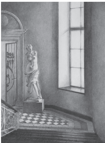
Іл. 3. Рисунок інтер'єру