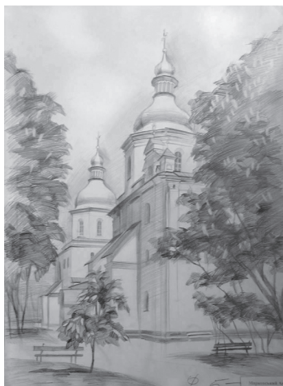
Іл. 4. Рисунок екстер'єру