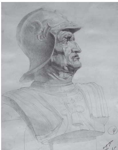
Іл. 1. Рисунок неканонічної гіпсової голови