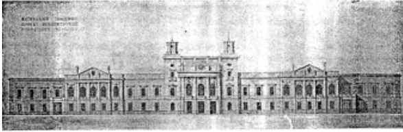
Лл. 2. Київський іподром. Проект реконструкції. Арх. В. М. Риков. [19, С. 9]. 1935

кінних змагань [12, арк. 3–26]. Таким чином, упродовж 1931–1932 рр. були відновлені дах і частина верхнього перекриття будівлі іподрому, а міжповерхові перекриття залишилися невідновленими [11, арк. 51].