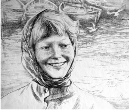
Іл. 2. Із циклу «Рибалки Азова». Кулькова ручка . 40,5х38,5. 1985

філософське трактування сцени обрізання коси – символу гордості та жіночої вроди.