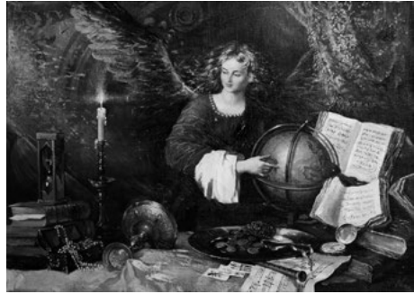
Іл. 3. Час. Полотно, олія. 65х90. 2001

Вартим особливої уваги є твір під назвою «Час» (іл. 3), характерним для якого є алегорична сутність задуму. Композиційний центр картини – це постать ангела, що нагадує про буденність земного життя та розкриває сутність мирського буття людини, плинність часу... На першому плані композиції розташовані предмети, які уособлюють символічні поняття життєвих пристрастей людини. Автор застосовує принципи кулісної композиції: з одного боку зображує червону завісу, яка відокремлює матеріальний світ предметів та спокус від духовного та нематеріального всесвіту. Палаюча свічка – символ життя в часовому проміжку, яке іде своєю чергою. Таким є творчий пошук та філософські роздуми художника про життя, про його швидкоплинність, про вічні людські цінності та моральні устої, про чаруючий світ мистецтва.