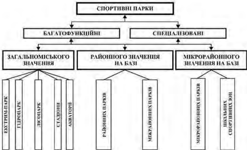
Іл. 1. Класифікація спортивних парків (пропозиція автора)

Спортивний комітет України здійснив спробу реалізувати кілька спортивних парків на Миколаївській слобідці, у Голосіївському парку і парку Дружби народів. Однак, у них на перше місце виступає комерційний зиск, увага до спортивної багатофункційності та масовості використання цих спортивних споруд відходить на другий план. Проте, Спортивний комітет України пере-