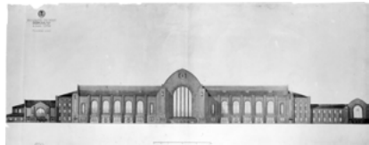
Іл. 3. Конкурсний проект залізничного вокзалу. Головний фасад. 1927