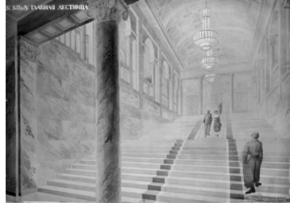
Іл. 7. Альошин П. Ф. РНК. Головний фасад. Конкурс на забудову урядового кварталу у м. Києві. II тур. 1934–1935

Кути, розгорнуті до Дніпра, увінчуються баштами. Членування баштових об'ємів в перших двох рівнях співпадає з основними спорудами, треті та четверті рівні вертикально-спрямовані, домінують в силуеті будов; треті – декоровані видовженими напівциркульними прорізами аркади; четверті, зберігаючи загаль-