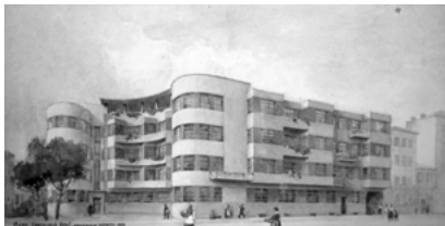
Іл. 1. Альошин П. Ф. Перший будинок радянського лікаря. 1928–1930

1924 рр. обіймав посаду Київського губернського архітектора. З-поміж численних реалізованих та нереалізованих проєктів майстра ми, в рамках даної статті, зупинимось на ключових, на нашу думку, об'єктах, що найкраще відображають пошуки ідентичності, «формули міста» київської архітектури.