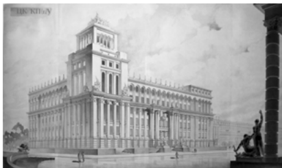
Іл. 5. Альошин П. Ф. ЦК КП(б)У. Перспектива з боку Дніпра. Конкурс на забудову урядового кварталу у м. Києві. II тур. 1934–1935

На жаль, ще до завершення проектування між співавторами виникли суперечності, які зрештою призвели до того,