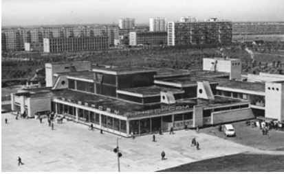
Іл. 4. Універсам на Микільській Борщагівці. 1973 [10]