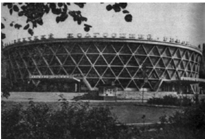
Іл. 5. Експериментальний критий ринок по вул. Кудряшова [11]

могли задовольнити потреби мешканців багатотисячних житлових масивів, отже, з'явилося широке поле для архітектурної творчості. Першим великомасштабним закладом торгівлі в Києві став універсам на Микільській Борщагівці, відкритий 1973 року (архітектори М. П. Буділовський, І. Н. Печонов, В. Я. Дризо) (іл. 4). Об'єкт уже сам по собі був новаторським, оскільки магазинів такого розміру і з такою схемою торгівлі у Києві ще не будували. Окрім універсаму, до складу корпусу входили будівлі кіно-театру, універмаг, будинок побуту та ресторан. Складний рельєф території будівництва був використаний автoрами проекту для створення системи майданів та пішохідних алей зі схода-