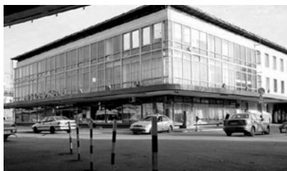
Іл. 1 Автовокзал у Києві: а – початковий ескіз; б – сучасний вигляд

ментальний критий ринок по вул. Кудряшова (1973); універмаг «Дитячий світ» по вул. Малишка (1975); Будинок художника на Львівській площі (1977–1978); будівля Центральної наукової бібліотеки АН УРСР (1979); лікарня для вчених (1981); готель «Салют» на площі Слави (1982–1984).