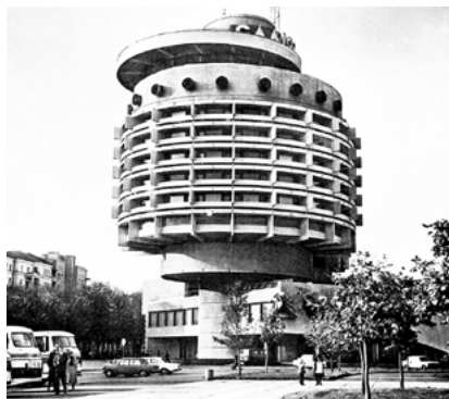
Іл. 6. Готель «Салют» [8]