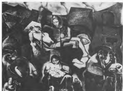
Іл. 2. О. Овчинникова. «Пієта» (народження Мікеланджело Буонаротті) із серії «Художник малює матір». Літографія. 1982

На спеціалізованій виставці естампа «Естамп-1982», серед розмаїття графічних технік літографія була найбільш поширеною. Так, Г. Варкач виконав літографії із серії «О. С. Пушкін на півдні» (1982), А. Крвавич – аркуші «О. Радішев», «Г. Сковорода», «Т. Шевченко» із серії «Просвітитель» (1982), В. Посохов – літографії із серії «Квіти літа» (1981), В. Радько – літографію «В майстерні» (1981), В. Черватюк – «Зустріч з минулим», В. Іванов-Ахметов – «Стара вуличка», «Випуск-81 та Київ» (1980) та Ю. Рубашов естампи тушшю з емоційним забарвленням – «Вечір», «22 червня», «Вігер», «Тиша» (1980). В. Мовчан в аркушах I, II, III із серії «Дума про гармонію» (1981), виконаних в асоціативно-метафоричному ключі, використовує образну стилістику плаката: контрастні протиставлення форми та тону в геометризованому просторі. Філософські роздуми про долю і роль матері втілились в літографіях О. Овчинникової із серії «Художник малює матір», (1982): «Не рьдай мене, мати» (А. Рубльов), «Пієта» (народження Мікеланджело Буонаротті) (іл. 2), «Матері» (Кете