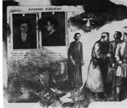
Іл. 1. В. Радько. Ілюстрації до книги М. Горького «Мати». Літографія. 1983

В майстерні станкової графіки (яку очолював професор І. Селіванов, а згодом, після його смерті, з 1985 р. – професор А. Чебикін), – студенти все ще працювали над політично заангажованими ленінськими, революцій-