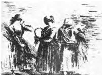
Іл. 4. Г. Галинська. «Льон» із серії «Полісся». Літографія. 1987

Г. Польовий створює графічну серію на воєнну тематику «Пам'ятні місця героїчної оборони Києва» (1985–1987). У літографіях цієї серії