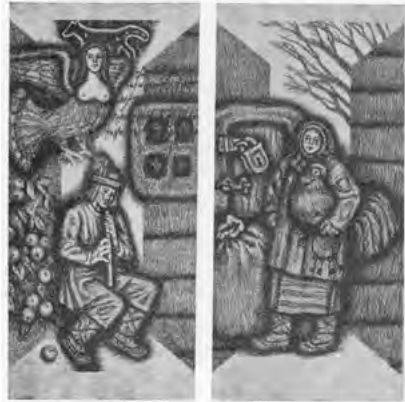
Іл. 3. А. Крвавич. Ілюстрація «Стрілець» до «Творів» Ю. Федьковича. Літографія. 1980

Київські художники, які працювали в галузі книжкової графіки, брали активну участь в Республіканських виставках ілюстрації та книжкового оформлення. На III Республіканській виставці «Художник і книга» демонструвалися кольорові літографії Г. Варкача із серії «Рими» (1980), Ю. Шейніса за мотивами творів В. Маяковського (1981), аркуші З. Кружкової за мотивами твору Є. Гребінки «Пригоди синьої асигнації»