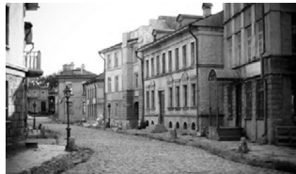
Іл. 4. Вуличні (натурні) декорації. Студія Мосфільм

Окремою зоною деяких кіностудій є вуличні (натурні) декорації (іл. 4). Їх поділяють на три типи: тимчасові (створені під конкретний фільм, а потім розібрані), постійні (архітектурні споруди, моделі міських площ, для знімання різних фільмів) та ланд-