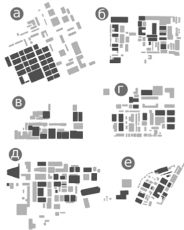
Іл. 3. Зонування закордонних кіностудій: а – Warner Brothers, б – Paramount, в – Sunset Gower Studio, г – 20th Century Fox, д – Pinewood, е – CBS Studio Center

Зелені зони займають від 7% до 40% території студій. Це можуть бути як розосереджені по території сквери, так і повноцінні парки. Так, наприклад, на території студії Ріхаг, заснованій в США у 1986 році, зелена зона займає 30% території і навіть включає амфітеатр.