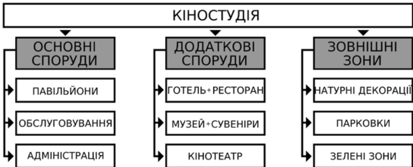
Іл. 6. Схема поділу кіностудії на функціональні групи

Кількість паркувальних місць є не достатньою, натомість площа зеленої зони досить велика. Територія кіностудії практично завжди закрита для звичайних жителів, і, як наслідок,