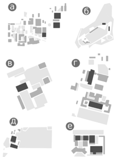
Іл. 5. Зонування українських кіностудій: а – Одеська кіностудія, б – Ялтинська кіностудія, в – Національна кінематика України, г – кіностудія ім. О. Довженка, д – Victoria Film Studios, е – студія Film.ua