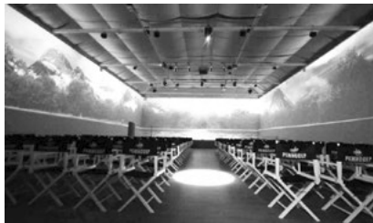
Іл. 2. Павільйон №1 на Одеській кіностудії

На території України перші кіностудії з'явилися відносно рано. Найдавнішими з них є Ялтинська кіностудія, відкрита в 1917 році і націоналізована радянською владою в 1919 році, та Одеська, де було створено такі відомі стрічки, як «Місце зустрічі змінити не можна», «Пригоди Електроніка», «В пошуках капітана Гранта».