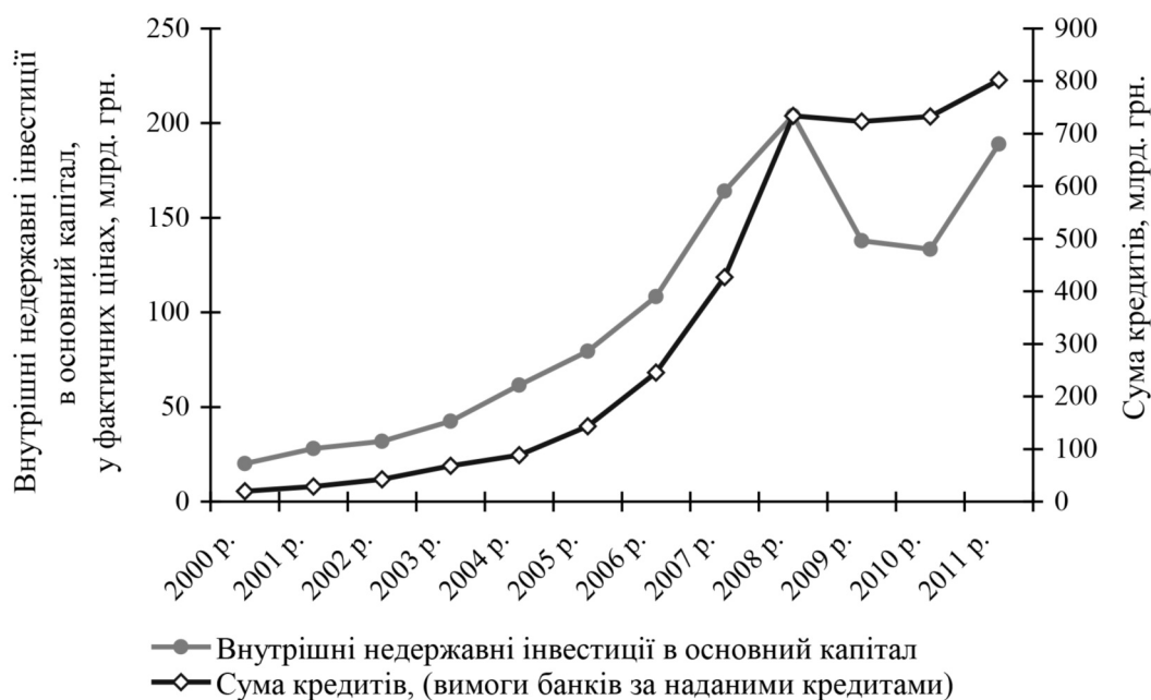
Рис. 2. Динаміка обсягів внутрішніх недержавних інвестицій і сум кредитів, наданих комерційними банками суб'єктам господарювання

Але у підсумку слід зазначити досить примітний вплив на процес інвестування грошово-кредитної політики, що зумовлює необхідність опрацювання її основних чинників. Із хрестоматійних положень економічної науки відомо, що за рівності інших умов обсяги отриманих бізнесом кредитів визначаються насамперед розмірами відсоткових ставок комерційних банків 8 . Оцінку цієї залежності здійснено на підставі розрахунку коефіцієнта кореляції – добутку моментів Пірсона, за допомогою якого можна розрахувати силу лінійної залежності між певними величинами. Для забезпечення коректності дослідження скорегуємо абсолютні значення розмірів кредитів, наданих комерційними банками