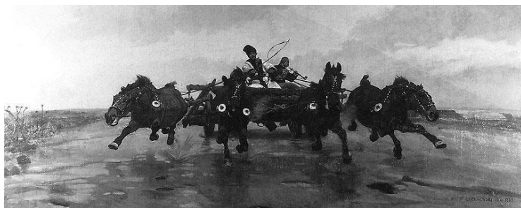
Юзеф Маріан Хелмоньскі. Четвірка [балагульська натичанка]. 1881. Полотно, олія. Національний музей у Кракові.

Бачимо в балагулів низку характерних ознак класичних субкультур. Серед них, власний жаргон, традиції і обряди, власна творчість, фольклор (пісні, приказки), зовнішній вигляд і стиль, активне епатажне демонстрування себе обивателям. Так ознаками власного балагульського аргю були вигуки “А-гій! Гій-го! Гі-гаго!”, “гура-га” з якими вони носилися на конях, а також “гурра! на врага”, яким балагули починали свої фіглі [між іншим, запозичений із відомої революційної пісні “Рухавка” Т. Падури – В. О.]. Брички балагули називали “натичанками”, а горілку – “старкою”, бешкети – “фіглями” [39, с. 18; 4, с. 147]. Виразно видно пародійну сторону балагульства: замість французької мови – “хлопська” українська, замість фраків і жабо – гуньки і шкіряні рейтузи, замість карет і фаєтонів – луб’яні брички-“натичанки”, замість дуелей – поєдинки на батобах [30, с. 132]. Це було тотальне заперечення шляхетського аристократичної, псевдоелітарної панівної культури.