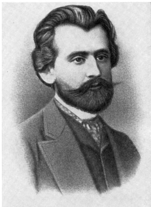
Павлин Свенціцький, хлопоман, актор, видавець, український і польський письменник

галицькими народовцями-“вечерничниками” “науково-літературної часописі” “Нива”. Свенціцький виступав у “Руському народному театрі” під артистичним іменем “Лозовський”, а в літературних творах підписувався як “Павло Свій” або “Стахурський”. Для ознайомлення польського соціуму з українською літературою він видав 4 випуски збірника “Sioło” (1866–1867), де оригінальні українські твори друковано латинською абеткою (формальна ознака “польських” хлопоманів) або у польському перекладі. Також П. Свенціцький один з перших запропонував галицьким русинам уживати подвійну назву “українсько-руський”, на позначення єдності місцевих галицьких українців із українцями інших регіонів [31, с. 167; 27, с. 483–484].