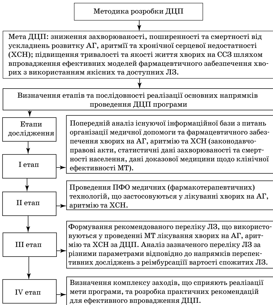
Рис. 1. Запропонована методика розробки ДЦП з кардіології

на наявність у економічно розвинутих країнах світу стійкої тенденції до зростання кількості хворих на ХСН. Цей факт пояснюється зростанням питомої ваги осіб похилого віку у загальній структурі населення, а також неефективністю профілактичних заходів та організації надання медичної допомоги та фармацевтичного забезпечення хворих на ССЗ [7].