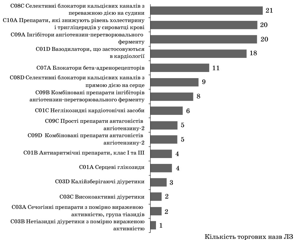
Рис. 3. Результати аналізу рекомендованого переліку ЛЗ відповідно до фармакотерапевтичних груп препаратів