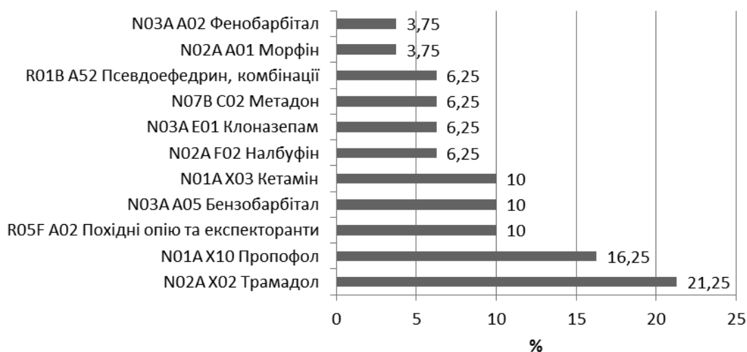
Рис. 1. Структура асортименту засобів, які містять контрольовані речовини, за групами АТС-класифікації

Встановлено, що перше місце за обсягами продажу у натуральному виразі посідає вітчизняний препарат Кодтерпін ІС®, табл. блістер, №10, ІнтерХім СП ВАТ (Україна, Одеса), з обсягом продажу за 2012 р. 14 233 023 уп., що перевищує зазначений показник на 129 % порівняно з показниками обсягів реалізації у 2011 р. Цей препарат посідає перше місце і за обсягами продажу у грошовому виразі, обсяги продажу якого у 2012 р. склали 270 270 тис. грн., що більше на 135 % порівняно з 2011 р.